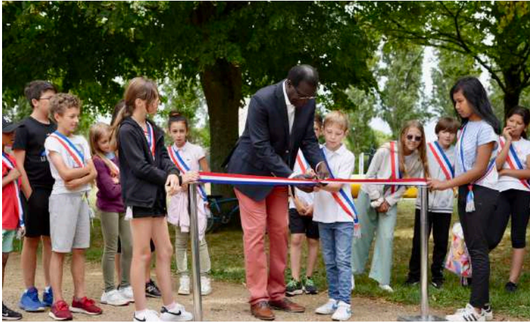
Inauguration du site de Marolles en Fête en présence des élus et du Conseil Municipal d'Enfants.

pu profiter du site lors des premiers jours. Cette deuxième édition a aussi été marquée par le report au 16 septembre des festivités du soir en raison des événements urbains en France du début de l'été.