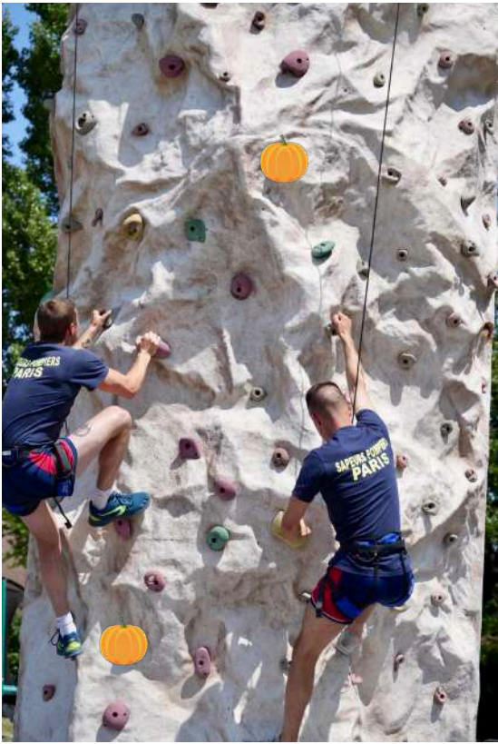
Les pompiers de Villecresnes se sont exercés à notre mur d'escalade devant de nombreux enfants admiratifs !