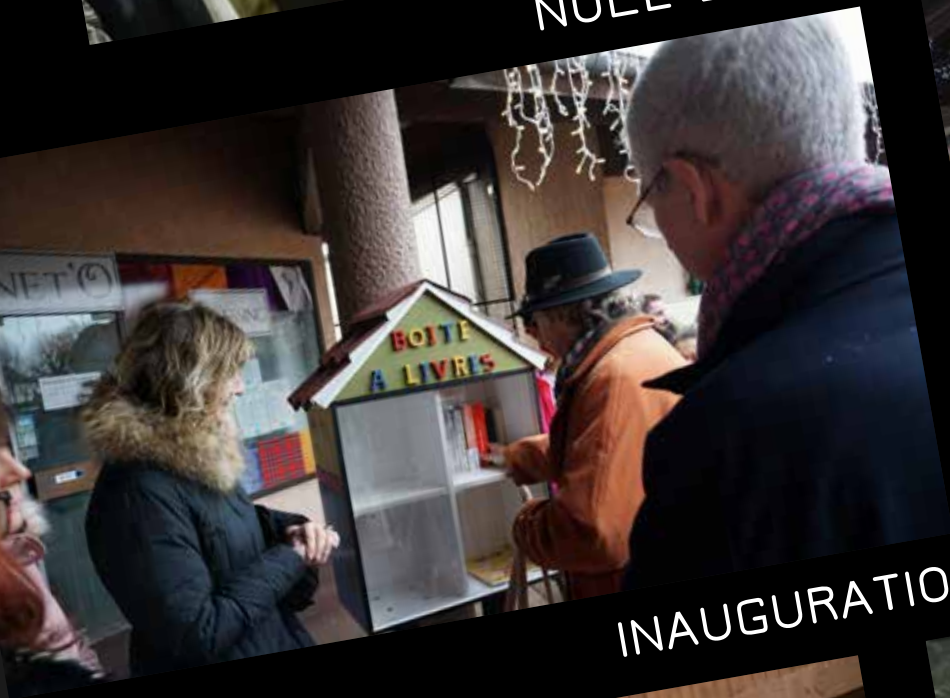
INAUGURATION BOÎTE À LIVRES