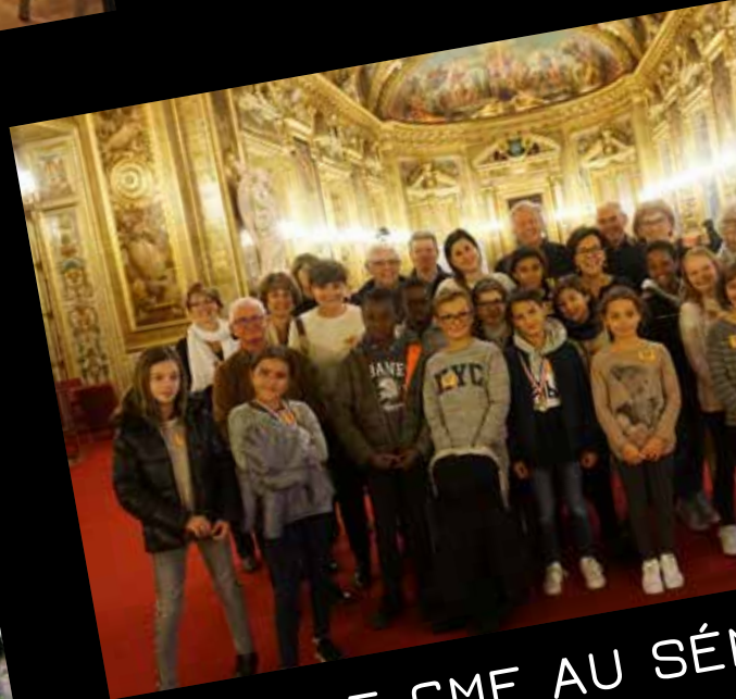
LE CME AU SÉN