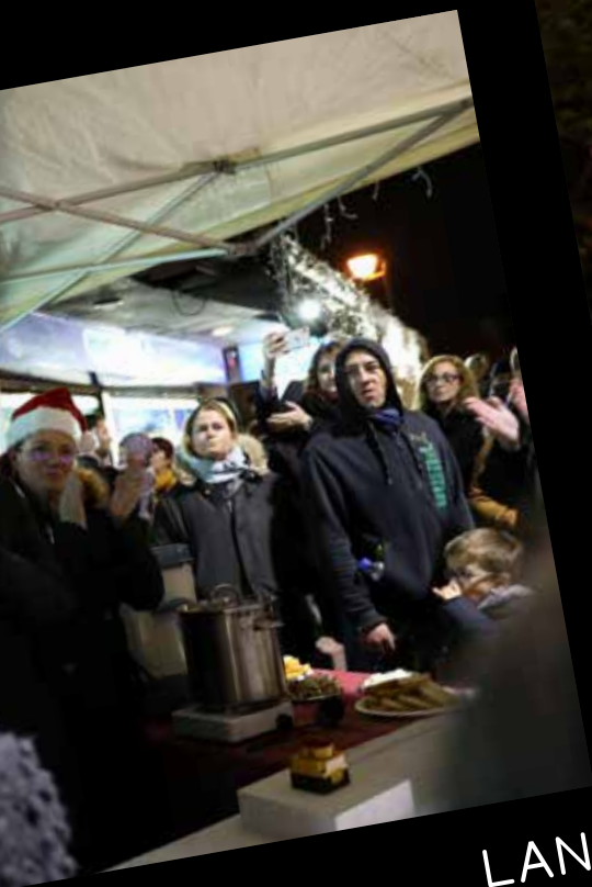
LANCEMENT DES ILLUMINATIONS