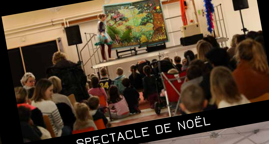
SPECTACLE DE NOËL