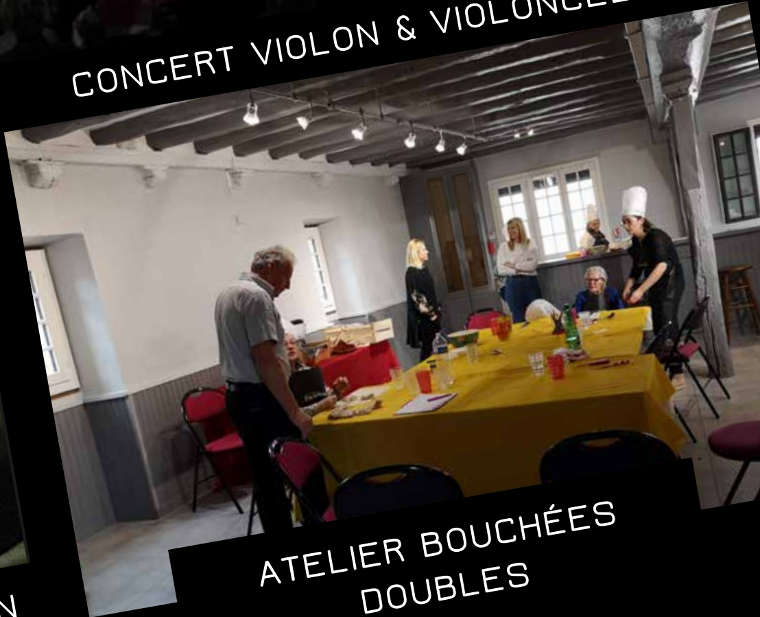
ATELIER BOUCHÉES DOUBLES