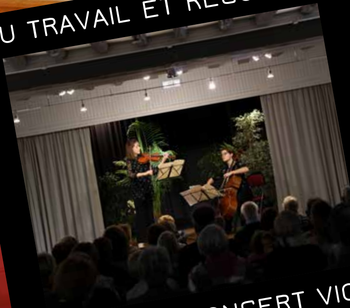
CONCERT VIOLON & VIOLONCELLE