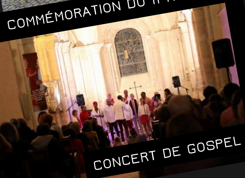
CONCERT DE GOSPEL