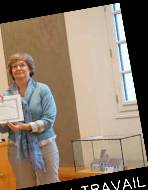
ILLES DU TRAVAIL ET RÉCOMPENSES BACHELIERS