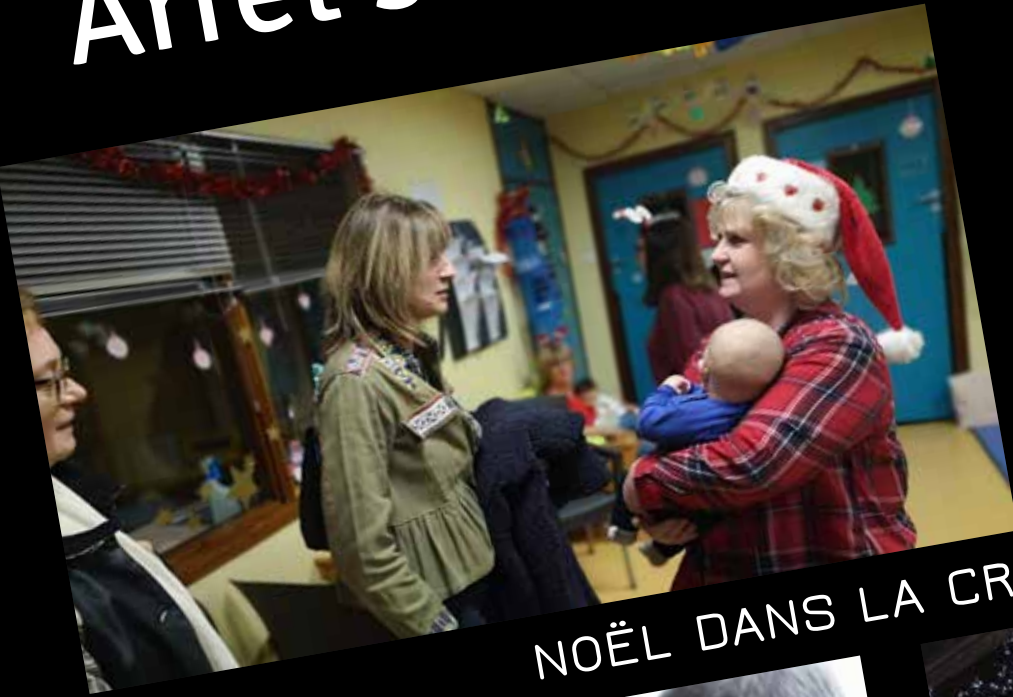
NOËL DANS LA CRÈCHE ET HALTE GARD