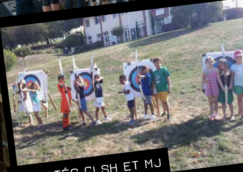
ACTIVITÉS CLSH ET MJ