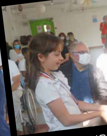
CÉRÉMONIE - 100 ANS