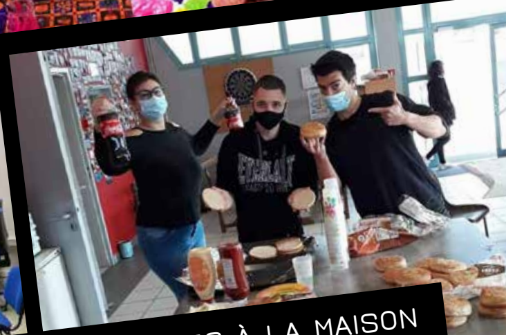
LES VACANCES À LA MAISON DES JEUNES