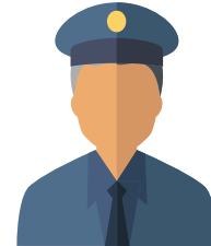
1 chef de police

En 2021, la Police pluricommunale comptera 8 agents :