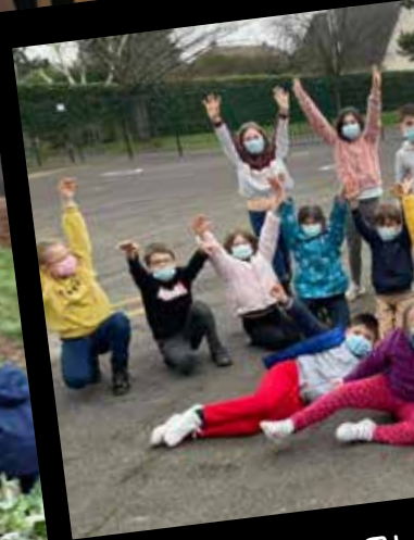
LES VACANCES AU CL