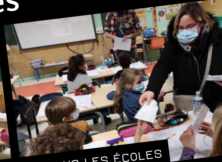
DISTRIBUTION DE MASQUES DANS LES ÉCOLES