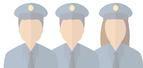
3 agents en cours de recrutement