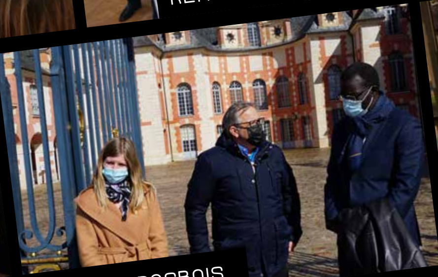
CHALLENGE DE GROUSBOIS