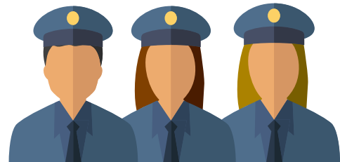
3 agents de police en poste