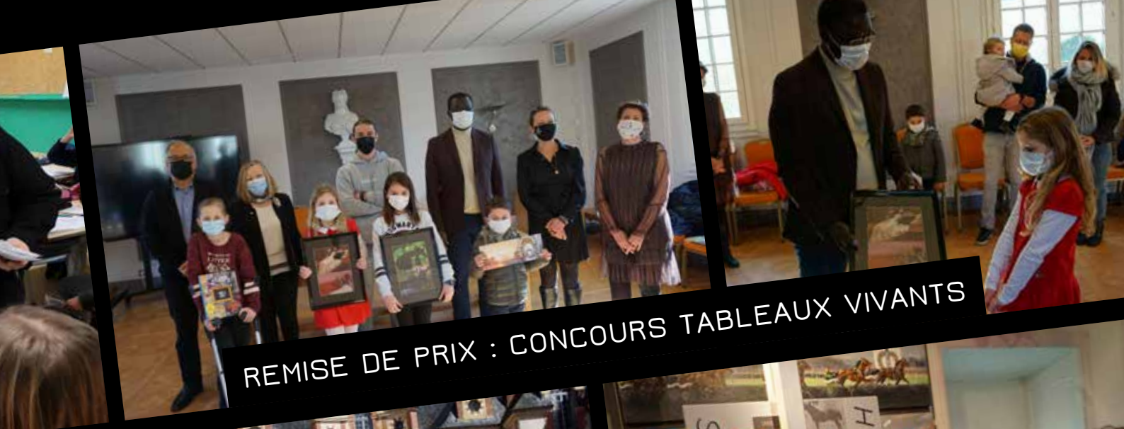
REMISE DE PRIX : CONCOURS TABLEAUX VIVANTS