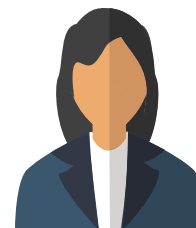
1 agent administratif à l'accueil

En 2022, nous devrions atteindre l'effectif de 12 agents.