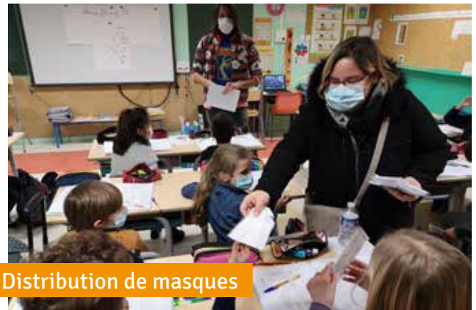
Distribution de masques

Avril 2021 - Mise en place d'une police pluri-communale regroupant les villes de Santeny, Mandres-les-Roses, Périgny-sur-Yerres et Marolles-en-Brie ; cette nouvelle police permet de bénéficier de davantage d'effectif à moindre coût. Cet été, trois nouveaux agents intègrent l'effectif, soit un total de 7 agents. L'objectif pour 2022 sera d'être doté d'une police de 12 agents.