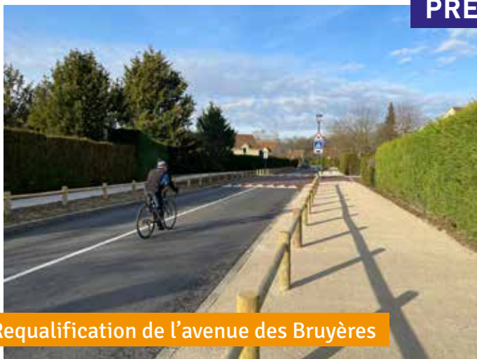
Requalification de l'avenue des Bruyères