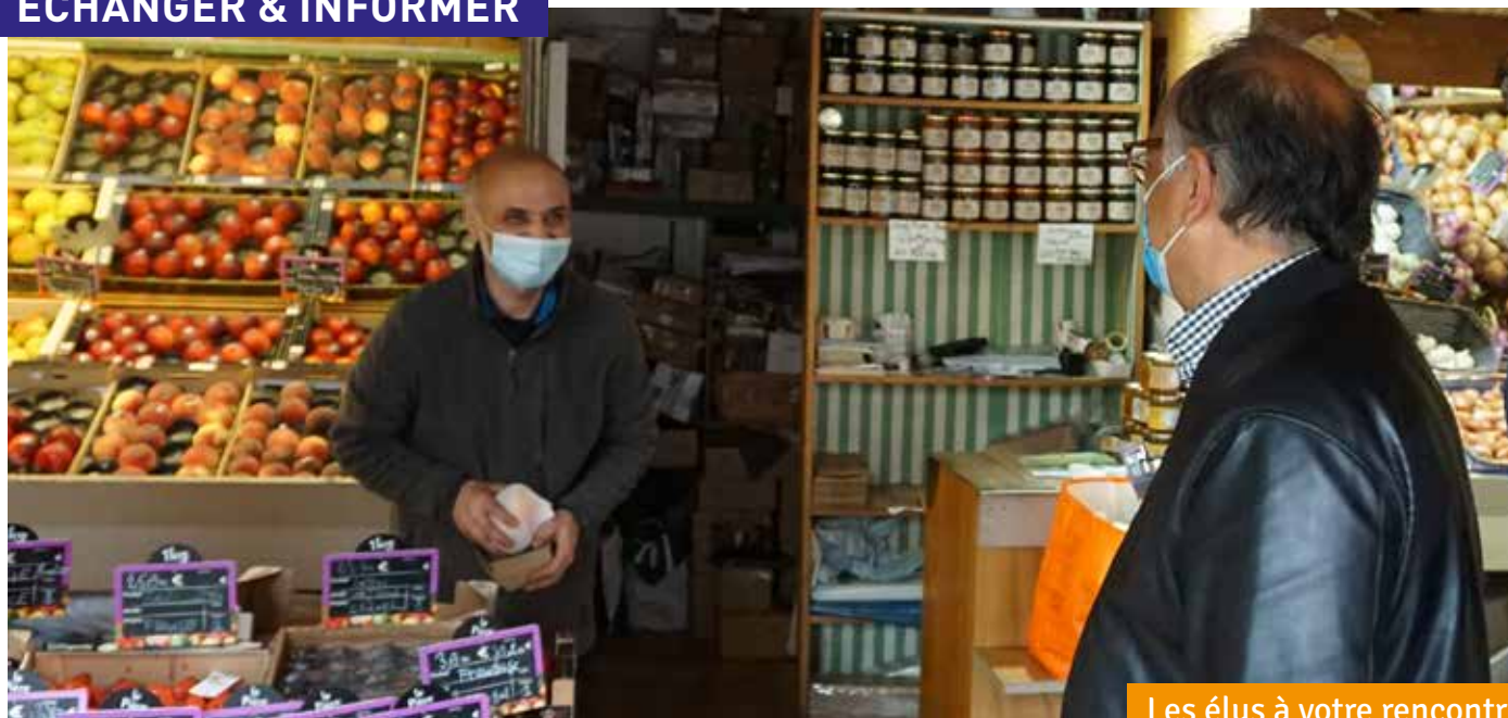
Les élus à votre rencontre