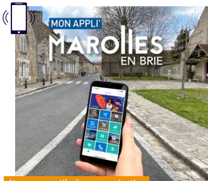
Nouveaux outils de communication