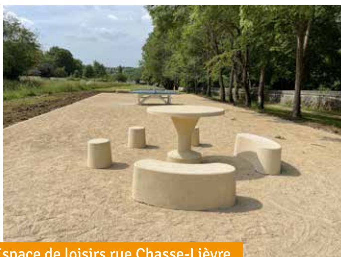
Espace de loisirs rue Chasse-Lièvre